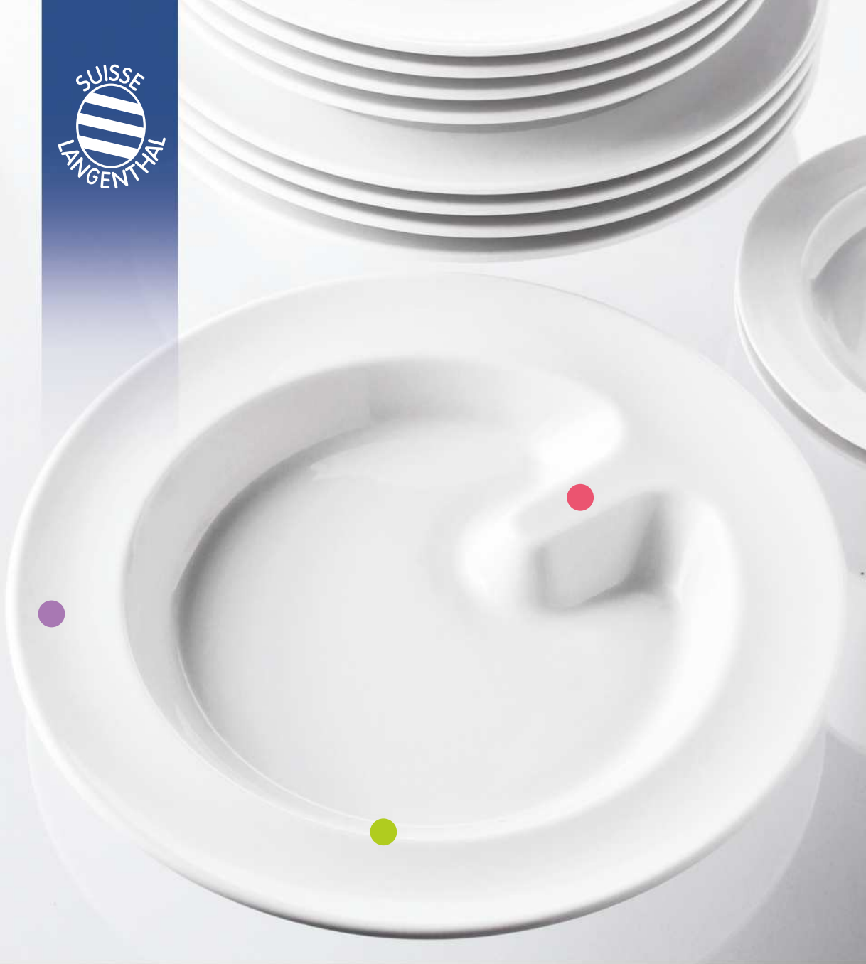
Teller halbtief Spezial